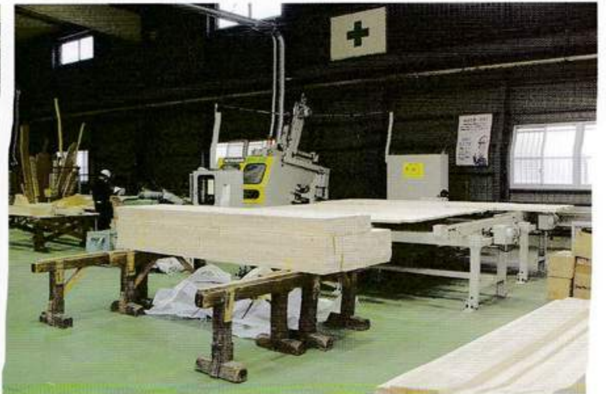
入替えて移設された⑨の羽柄材の加工ライン