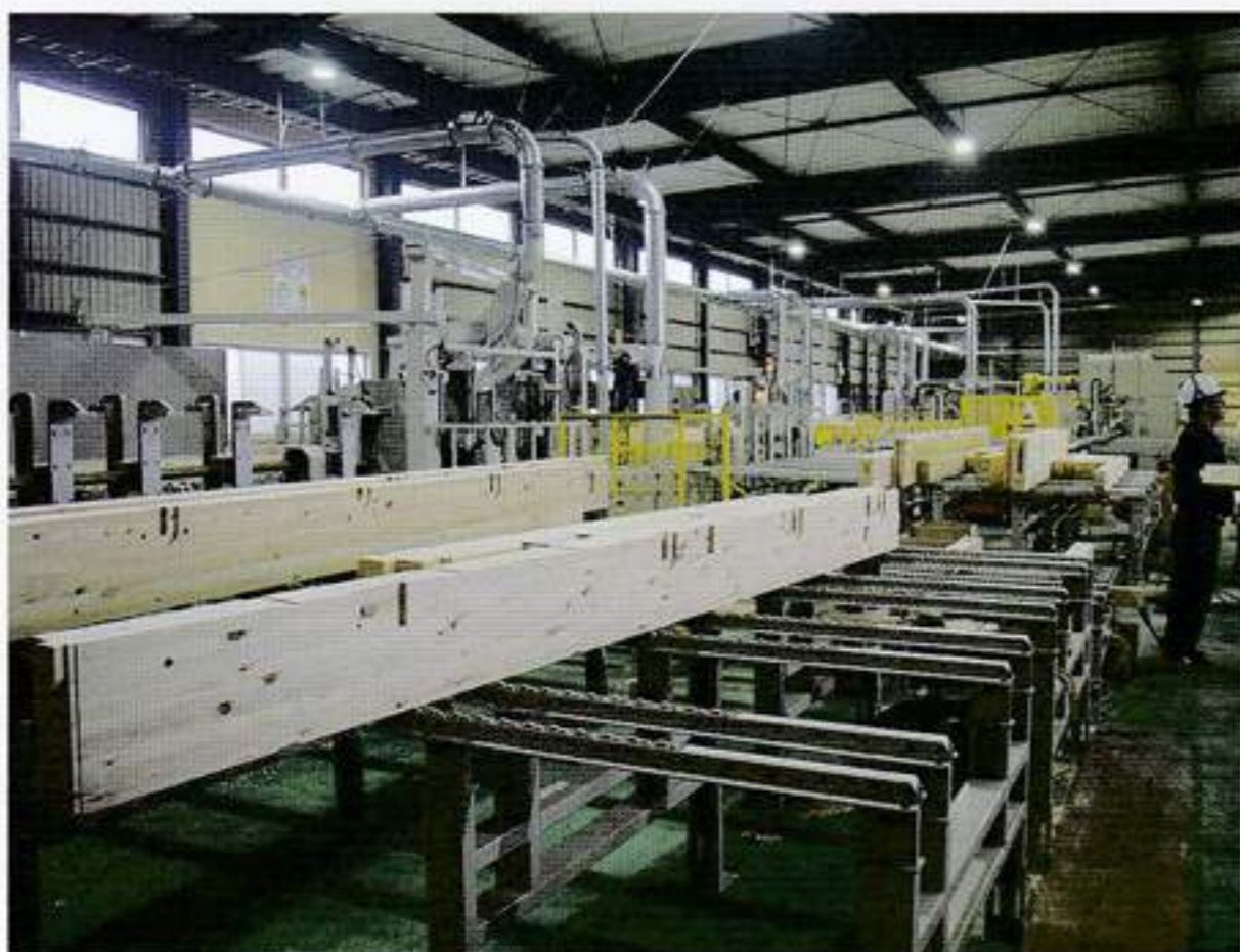
2箇所に分散して設けられた製品排出のコンベア