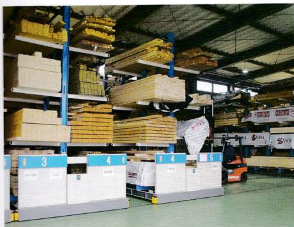
案件・樹種別に分類された①の自動式製品ラック

正確かつ効率的に作業を行うことができる。自動ラックは案件や樹種などのカテゴリに分類されており、リモート操作で任意のラックを動かした後にフォークリフトで搬入出を行う仕組みとなっている。