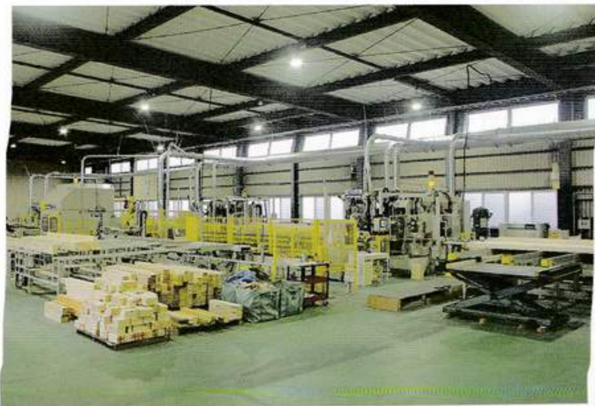
今回導入されたMPS-VX04W (6m仕様)