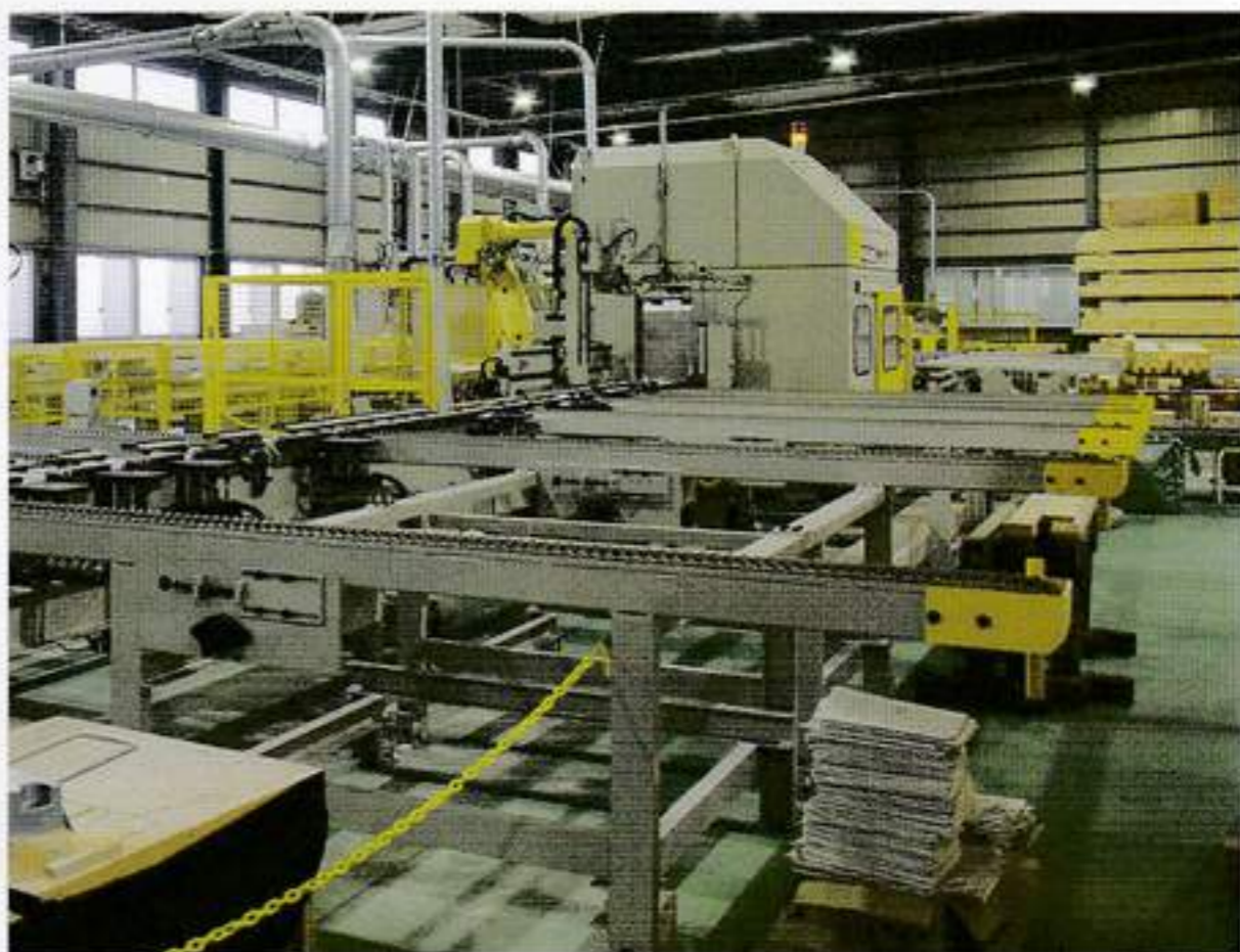
大断面材の単独投入口