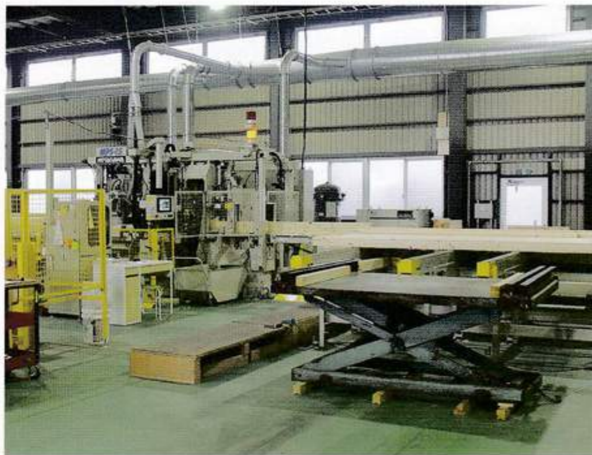
材料の投入口と③の横架材中間加工機 (MPS-15)