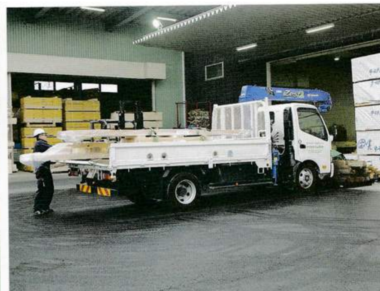
製品の配送はほとんどが自社便となっている