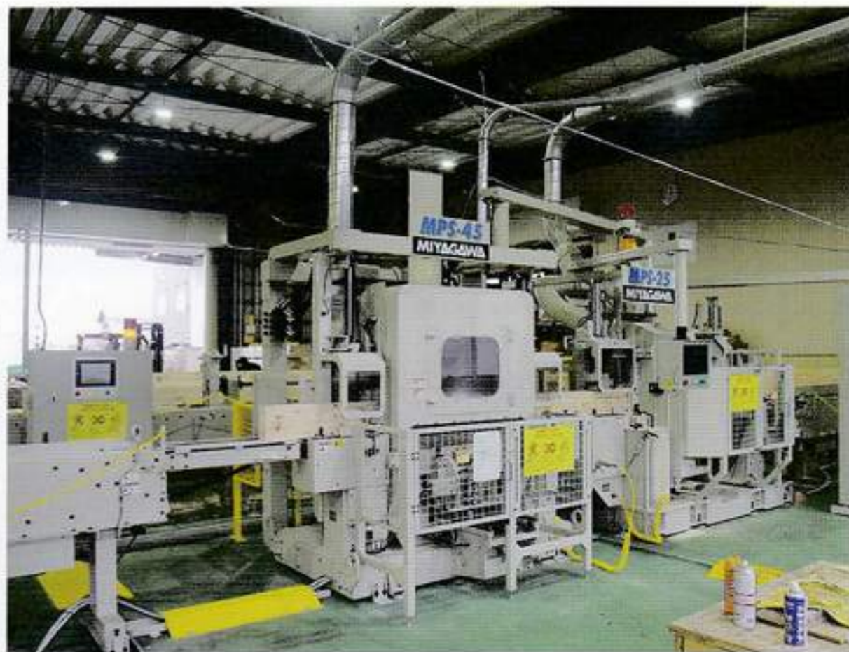
⑤のスリット加工機 (左) と⑥の木口加工機 (右)